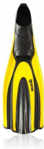
Palmes MARES jaunes